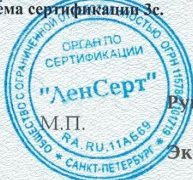
Схема сертификации Зс.